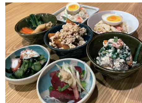
お好きなメニューを3品 「日替わりおばんざい3種」▶